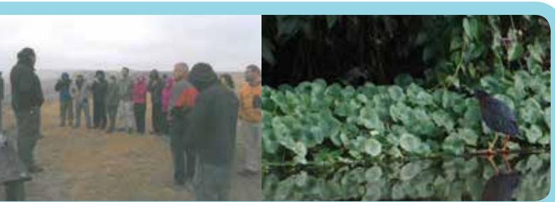
Charla Seminario Móvil Turismo en ASP, EEUU, 2013

Los recursos asignados a este Subcomponente financiarán: (i) obras y su equipamiento que sirvan de plataforma para el desarrollo de los productos turísticos, tales como: áreas de recepción y registro de visitantes, senderos, centros de visitantes, albergues para el alojamiento de turistas (sólo para el ASP de Corcovado), baños y sistemas de tratamiento de desechos, miradores, puentes y muelles y rehabilitación de caminos internos, torres de observación, rampas, pasos elevados, equipamiento para áreas de acampar y comedor turístico, señalización e interpretación turística, entre otras; (ii) estudios de pre-factibilidad y factibilidad (incluyendo EIA) para las inversiones propuestas que lo requieran.