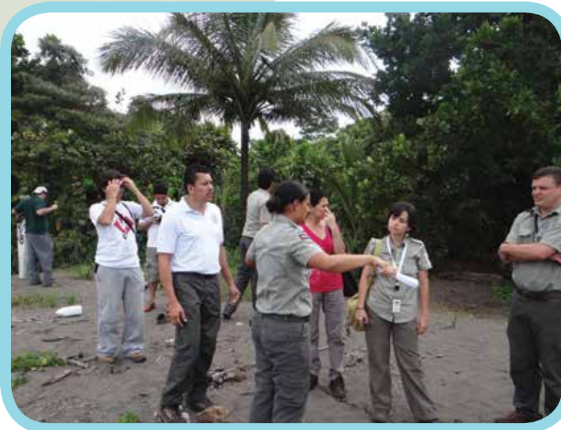
Taller en el Parque Nacional Tortuguero, 2013