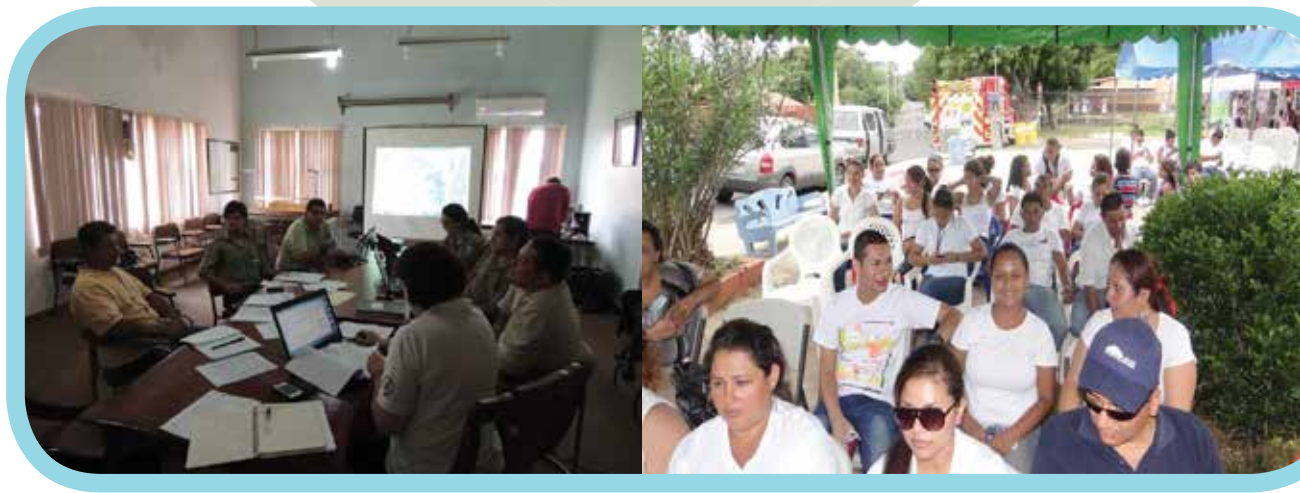
Reunión UCP, PTS-ACAHN y Municipalidad de Guatuso, 2013

De la misma forma, se trabajó en proporcionar a los profesionales de turismo y asociados el equipo necesario para realizar su trabajo, adquiriendo Equipo de Cómputo y Oficina, así como de Transporte (terrestre y acuático). Otra área de trabajo tendiente a la consolidación del Equipo Nacional de Turismo fue la capacitación al personal.