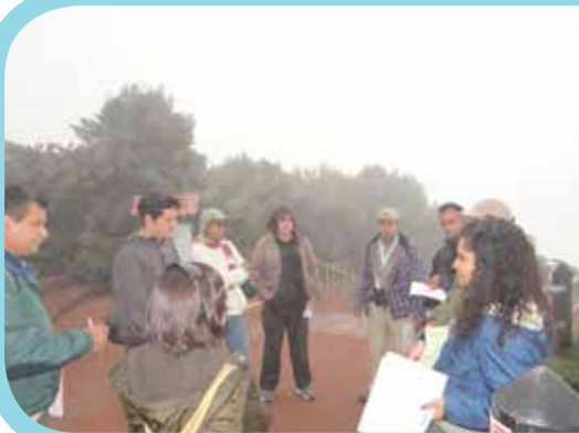
Taller en el Parque Nacional Volcán Poás, 2013

de los recursos de financiamiento del BID. Un total de $ 3,589.912 (tres millones quinientos ochenta y nueve mil novecientos doce dólares) quedaron comprometidos para inicios del 2014, con licitaciones y adjudicaciones en proceso.