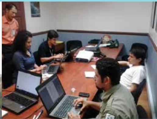
Reuniones comisión Sector Privado, 2013