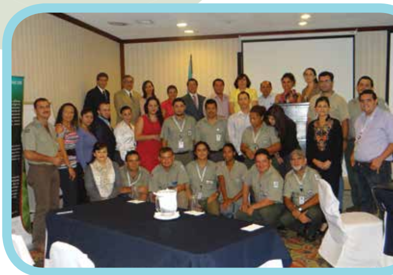
Ministro del MINAE y Funcionarios del SINAC relacionados con el Proyecto, durante la firma de Convenios con las Municipalidades, 2013

Este Subcomponente estará dirigido a: cámaras locales de turismo, comités de desarrollo, microempresas, organizaciones comunales, incluyendo organizaciones indígenas, y Organizaciones No Gubernamentales (ONG), directamente involucradas en aspectos relevantes del desarrollo turístico micro regional y vinculadas a los productos turísticos identificados en los planes de Turismo. Con los recursos asignados a este Subcomponente serán financiados: (i) estudios sobre oportunidades turísticas para empresarios locales; (ii) certificación de concesionarios para servicios no esenciales en áreas protegidas; (iii) capacitación y acreditación a guías turísticos que operarán en las áreas protegidas; (iv) asistencia técnica y capacitación a los actores privados locales en nuevas tecnologías e innovación en los productos, los temas de legislación ambiental y turística, normativa de áreas protegidas, gestión ambiental y gestión sostenible del turismo, y (v) fortalecimiento o apoyo a la consolidación de encadenamientos productivos en turismo.