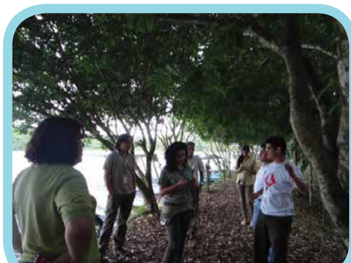
Recorrido de campo Comité Asesor del Proyecto al RNVSMCN, 2013

Este Comité, es un ente multisectorial de carácter asesor y plataforma de coordinación, conformado por representantes del Ente Ejecutor, del Instituto Costarricense de Turismo (ICT), Representantes de la Unión de Gobiernos Locales (UNGL), y representantes de la Cámara Nacional de Turismo (CANATUR).