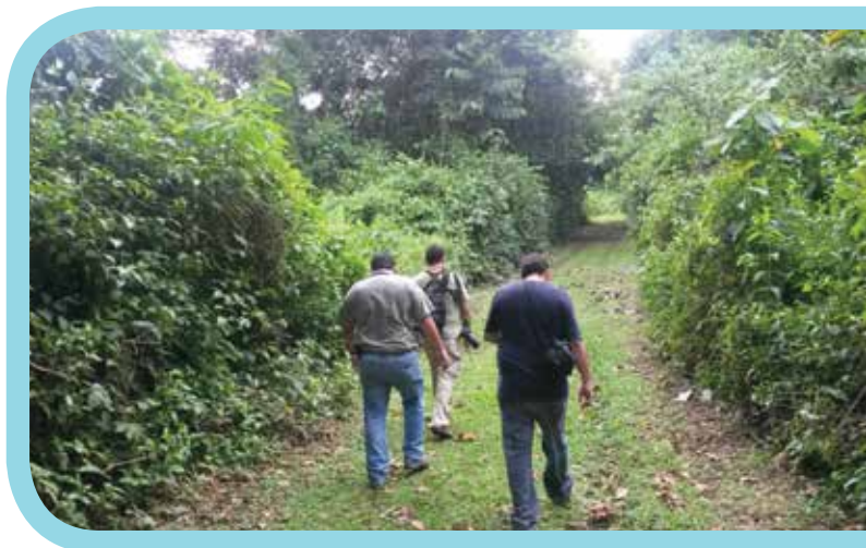
Caminata con el Administrador y Operador de Turismo del Parque Nacional Manuel Antonio, en los sitios donde se harán las inversiones en el Parque Nacional Volcán Arenal.

Esta publicación puede citarse sin previa autorización con la condición de que se mencione la fuente.