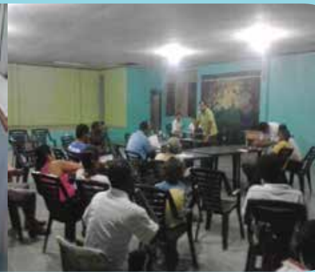
Participación en taller Guías Locales de Cahuita, 2013