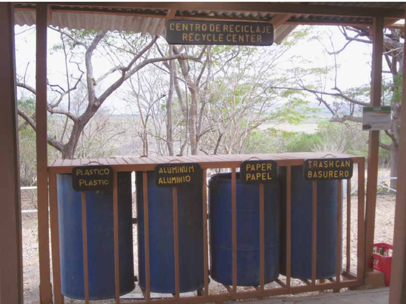
Recipientes para separación de materiales valorizables.

Por ejemplo, a continuación se muestra una fotografía que ilustra el manejo de residuos sólidos en el Parque Nacional Palo Verde.