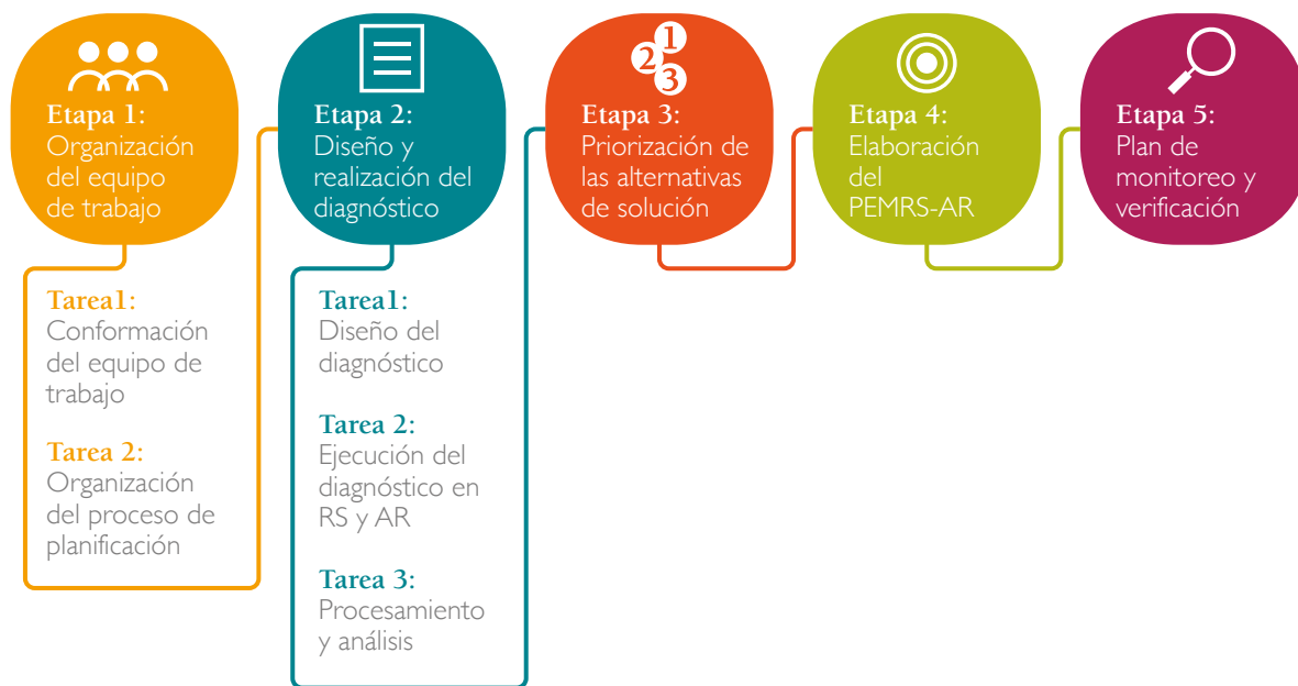
Figura 1. Etapas para la elaboración del PEGIRS-AR en ASP

A continuación se detalla cada una de las etapas anteriormente mencionadas.