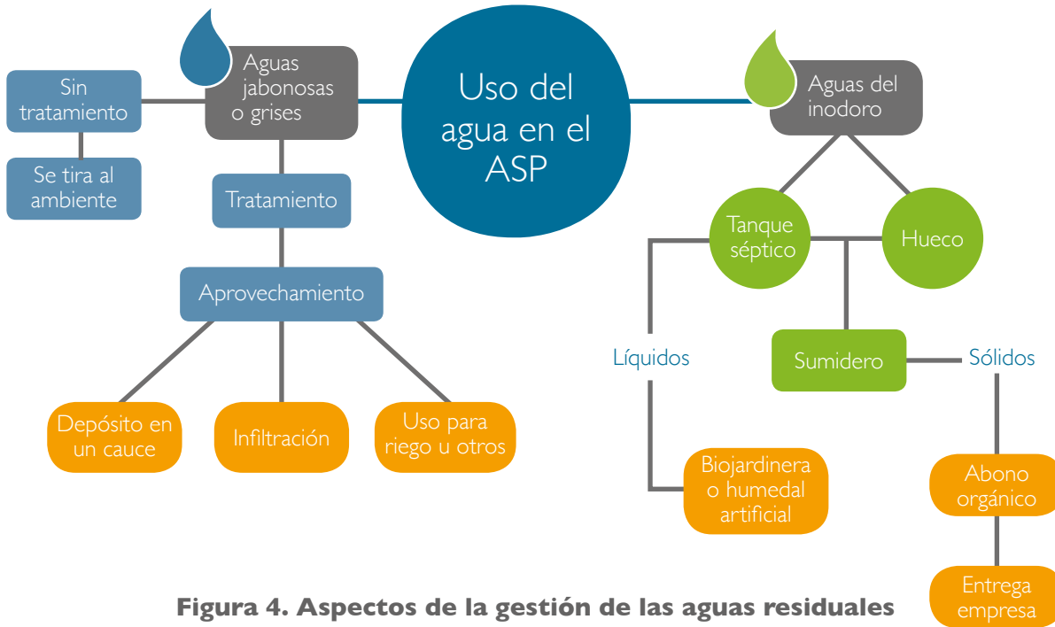
Figura 4. Aspectos de la gestión de las aguas residuales