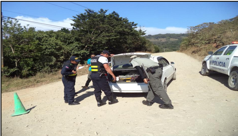
Figura 4. Revisión de Vehículos en carretera en el Área de Conservación Arenal Tempisque