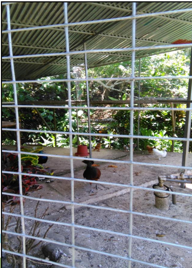
Figura 2. Seguimiento y Supervisión a Centros de Rescate y Manejo de Vida Silvestre. Área de Conservación Huetar Norte.