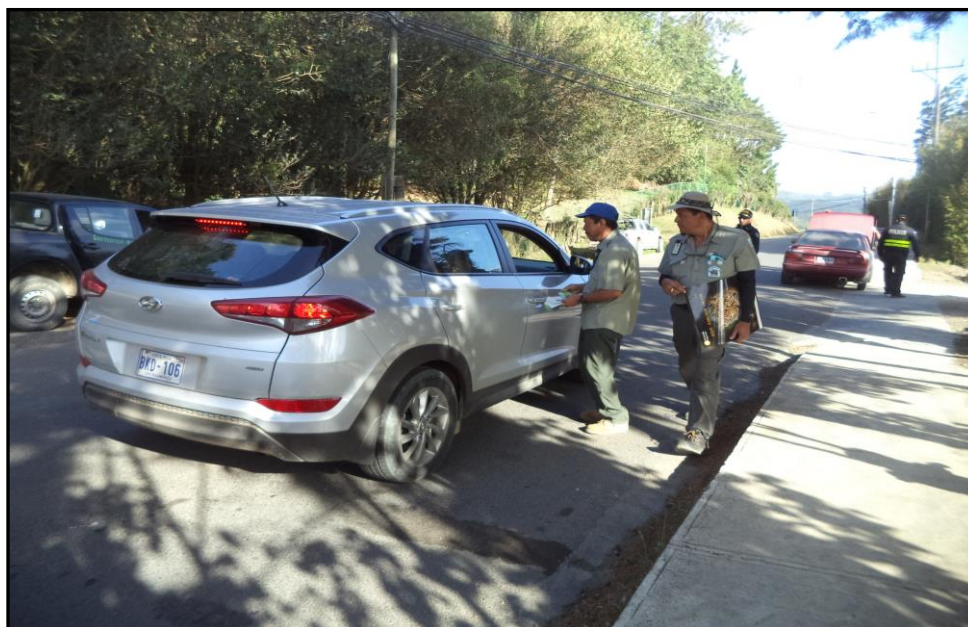
Figura 6. Retenes de Carretera informativos y de entrega de material. Área de Conservación Arenal Tempisque.