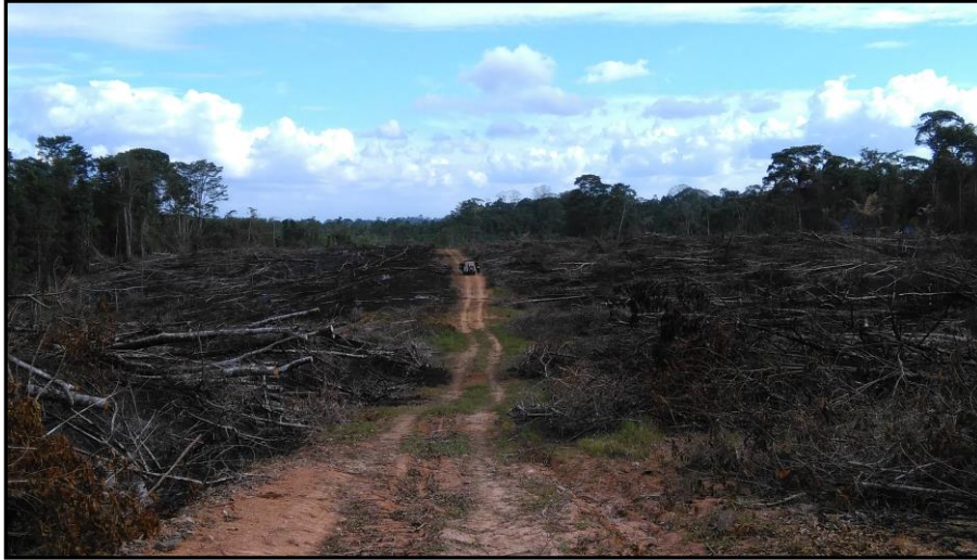
Figura 3. Inspecciones y atención de casos por acciones de tala. Área de Conservación Arenal Huetar Norte