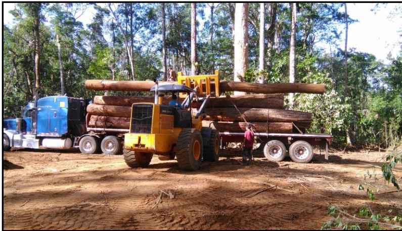
Figura 1. Seguimiento y supervisión a permisos de aprovechamiento. Área de Conservación Huetar Norte.