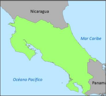
Diagrama de Ubicación

Fuente: Corredores Biológicos, SINAC, 2016 ASP, SINAC, 2016 Elaborado por: Departamento de Información y Regularización Territorial, Infraestructura de Datos Espaciales, SINAC